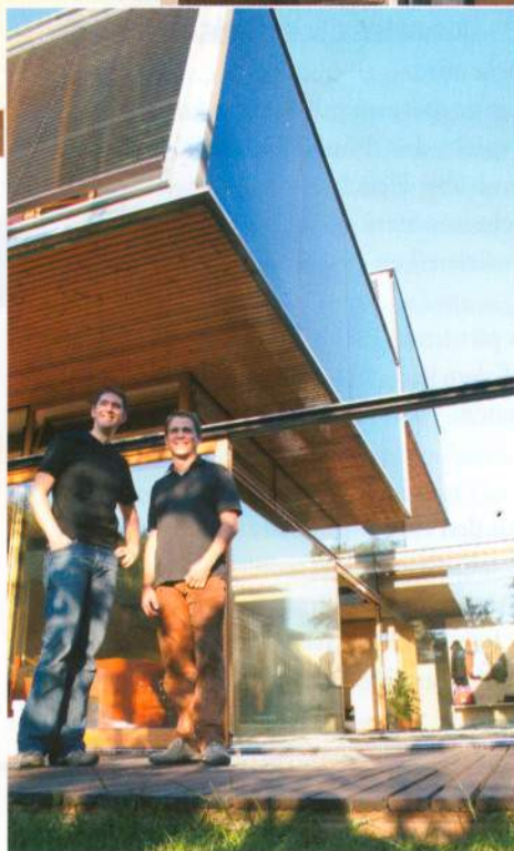
Das Architekten-Duo Formann und Puschmann lässt Boxen schweben und sorgt damit in Mödling für Hinsehen.